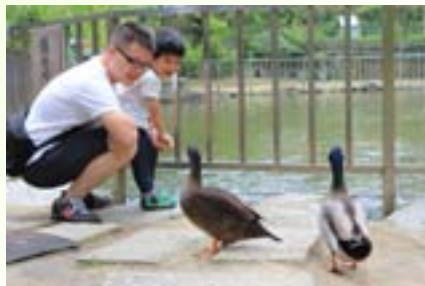
農場中親近人的鴨子

有5.5公尺的限制。經過一連串的協商變通，5.5公尺的寬道路就使用農路經費，多出的2.5公尺寬就用社區的地方經費。而其中各私有土地地主的犧牲貢獻不在話下，因為拓寬的道路幾乎都是私有土地！這中間的協調、討論而後有共識，實為難得一見的團結。