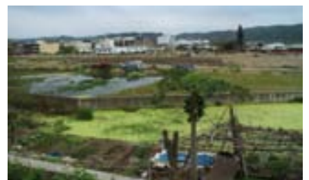
剛開始整地時的都市計畫區

人心是很難做決定的，尤其在「要」與「不要」、「捨」與「不捨」中去取捨，確有其矛盾與掙扎的難處。只是，改變在時間發展軸線上，如同滾動的輪子般前進，快速的轉動是沒有猶豫的時間，因此，「停滯」或「發展」將成為城市發展的結果之一。如果我們能有共識，必須承認改變是一種生活中必然的過程，只是「過」與「不過」不應該只是結果論而已，而是，生活在這裡的每一個人，都能積極參與城市發展的過程，從好生活、好體驗、好消費的觀點中去架構合理、適切與優質的生活模式，並在充分參與與表達中去做決定，似乎才是蛻變中居住於此的人們較為正向的態度。不要再漠然了！新埔的未來需要你、我的行動去捍衛與保護。