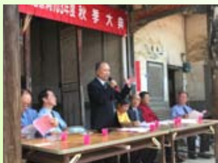
范氏家廟103年度秋季大典

有著如此遠大的目標，此刻，做為「范氏家廟」管理人及其管理團隊的一份子，為了能盡快達成目標，正戰戰兢兢的努力著！