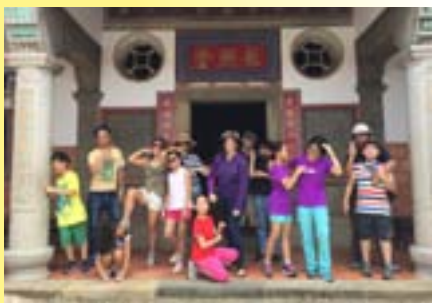
劉氏雙堂屋親子文化體驗活動

這樣的想法如何落實？首先，在和平街168號「磚木取夥故事劇場」這個空間，目前雖然尚未例行開放，卻固定每月最後一週週末，開放成為可欣賞以繪本、戲劇演出的「故事劇場」，呈現各種以親子為對象的自製故事，內容當然是用新埔在地文化為基底，例如先前呈現過的《怪獸吃光光》說的其實是花燈的故事，《是誰在說悄悄話？》則表現了山上果園中的小花，遇到炎熱夏天來臨時，會說出什麼樣的對話呢？